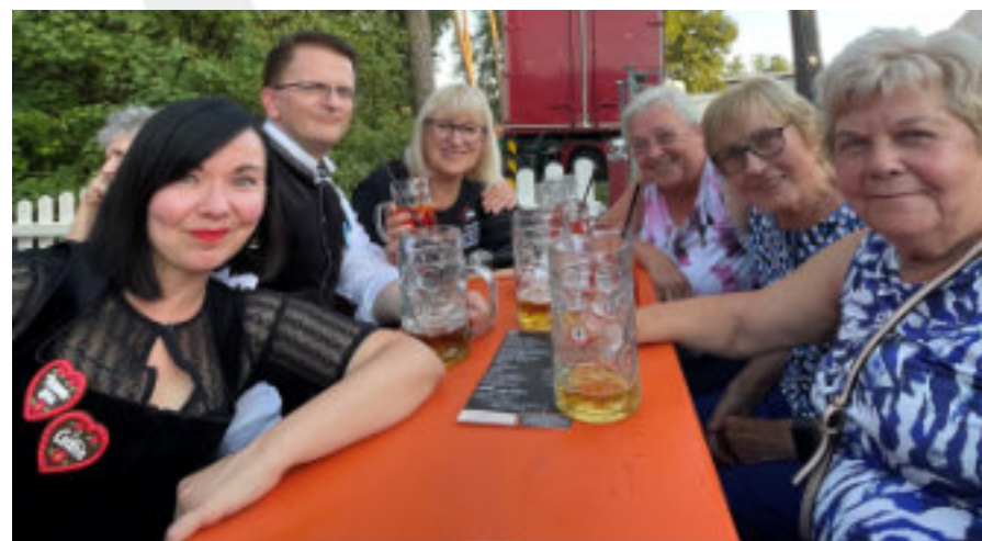
Katzwanger Kirchweih 2025