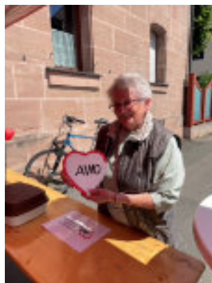
Bürgerfest Katzwang 2025