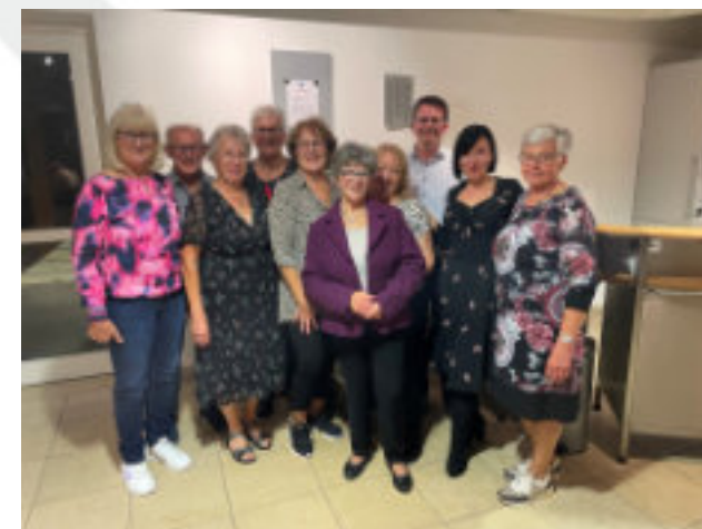
Zu Besuch beim Weinfest des Ortsvereins Schwanstetten